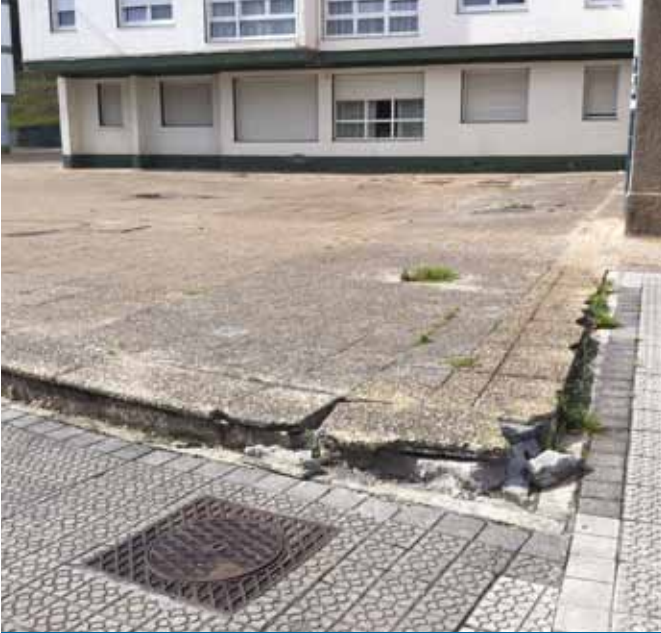
Patioak, birgaitze lanen aurretik.