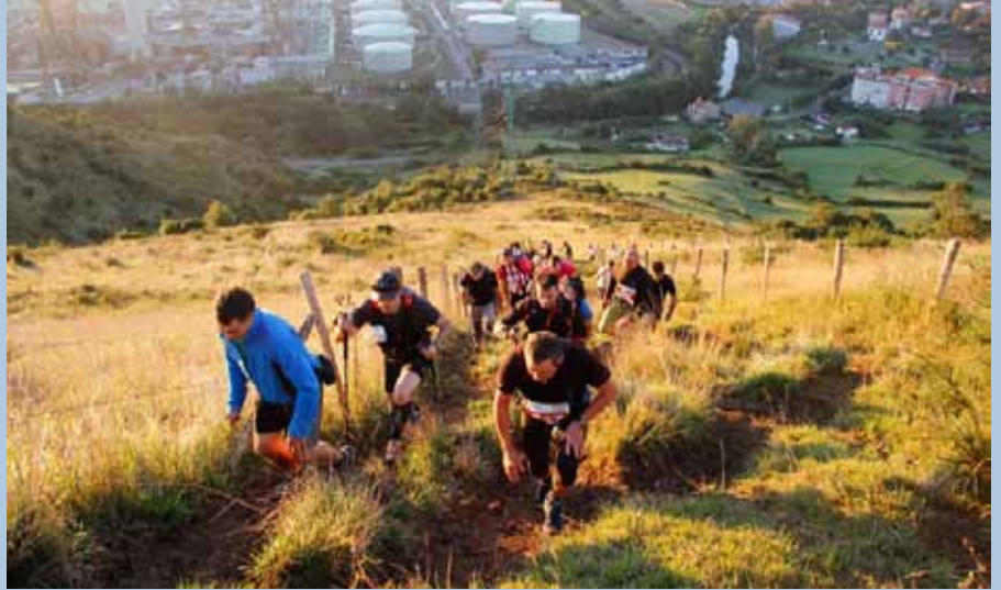
III. Mello Saria parte-hartzaileak.

G/Zer lorpenekin zaudete harroen? E/ Urte askotako aldarrikapenari eta lanari esker, gaur egun gune bat eskaintzeko modua